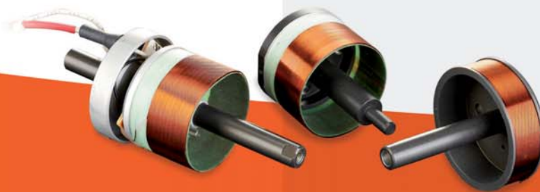
Bobine Voice-coil Voice-coil spool