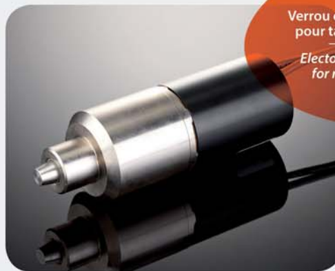
Verrou électromagnétique pour table de radiologie Electromagnetic locking for radiology tables